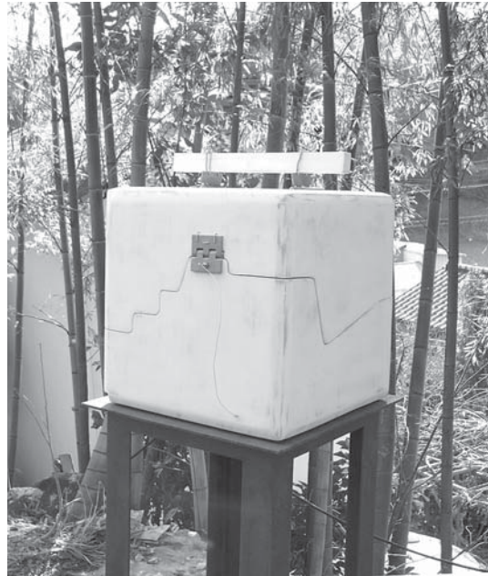
ランチボックス 1 木 鉄 ステンレス 300W×300D×360H