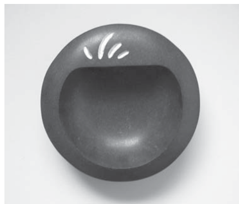
心呼吸 -土- 石 金箔 250W×250D×80H