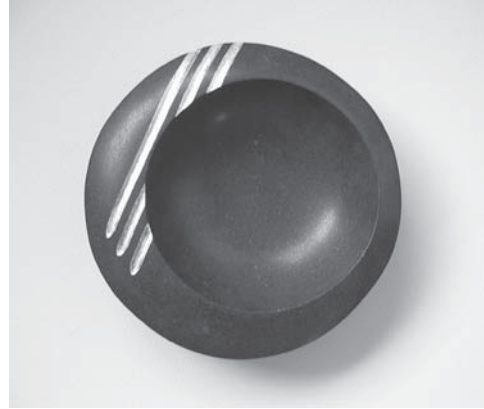
心呼吸 -光- 石 金箔 250W×250D×80H