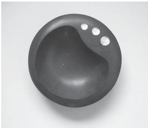
心呼吸 -水- 石 金箔 250W×250D×80H