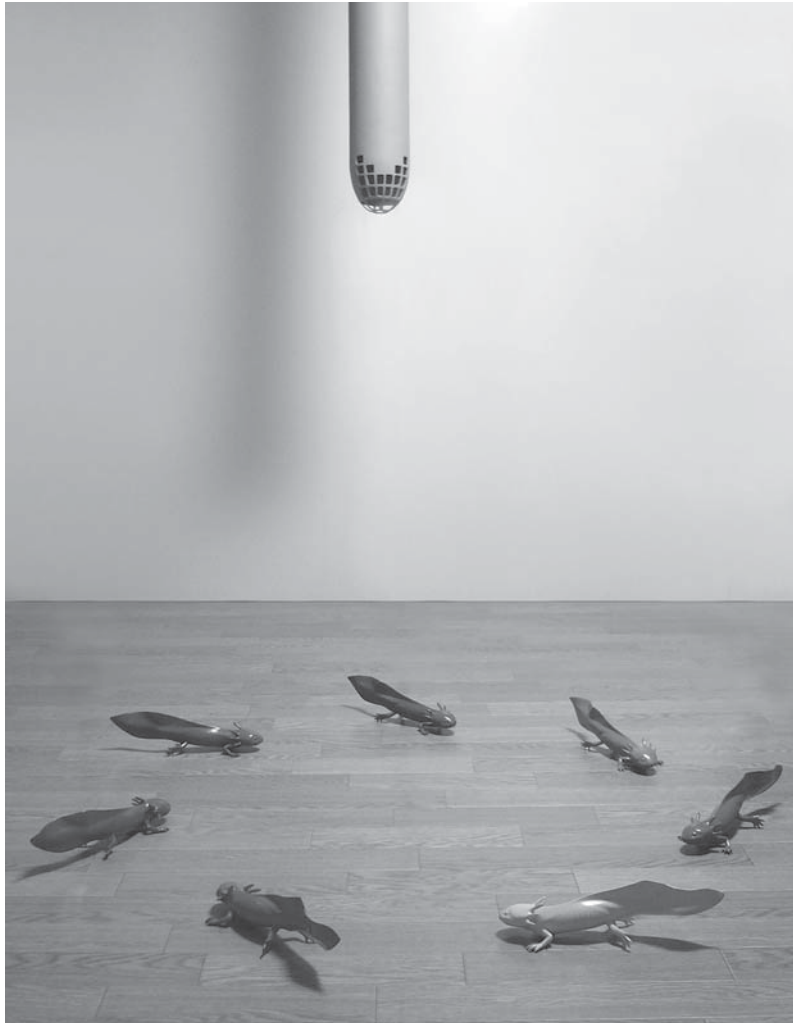
salaMandala / B-29 mixed media